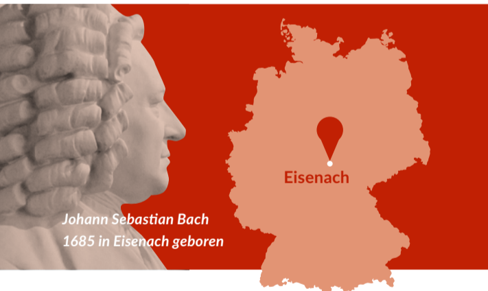
Johann Sebastian Bach 1685 in Eisenach geboren

In mitten von vier Tälern liegt Eisenach malerisch zu Füßen der Wartburg.